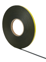
Banda de fixare 10x1 mm