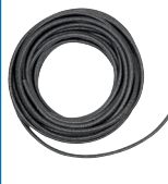
OTTOCORD PE-B2 de rezervă tijă de spumă