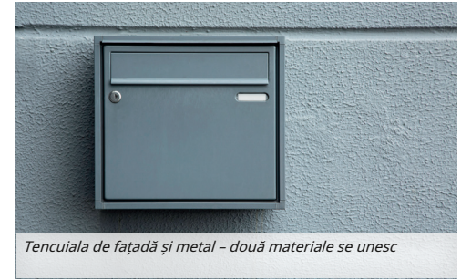
Tencuiala de fațadă și metal – două materiale se unesc