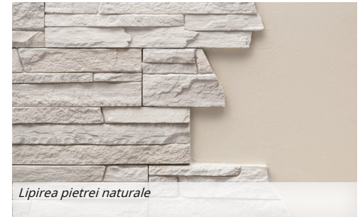
Lipirea pietrei naturale