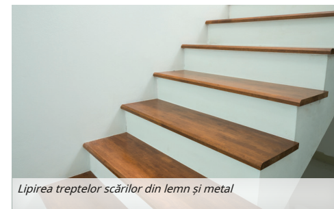
Lipirea treptelor scărilor din lemn și metal

Lipirea suporturilor din metal și plastic de ceramică sau substraturi minerale