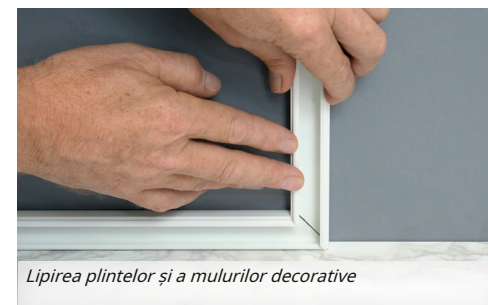
Lipirea plintelor și a mulurilor decorative