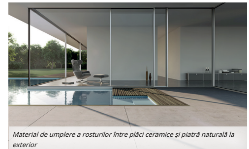
Material de umplere a rosturilor între plăci ceramice și piatră naturală la exterior