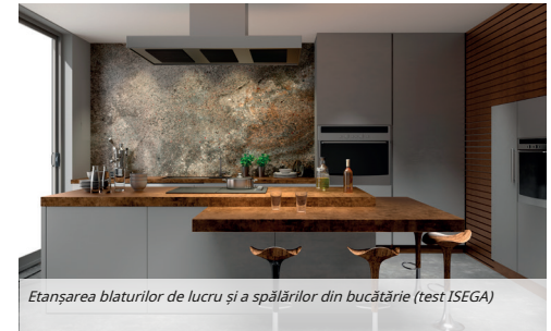
Etanșarea blaturilor de lucru și a spălărilor din bucătărie (test ISEGA)