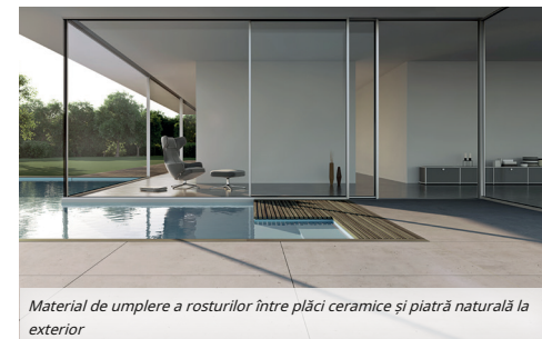
Material de umplere a rosturilor între plăci ceramice și piatră naturală la exterior