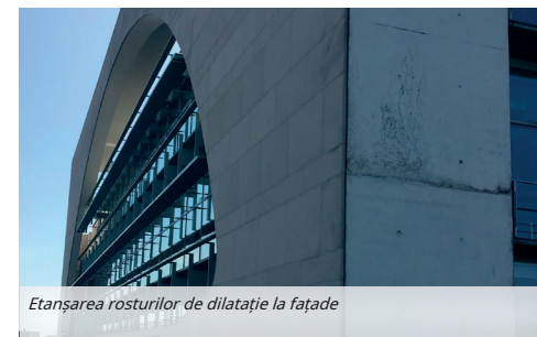
Etanșarea rosturilor de dilatație la fațade