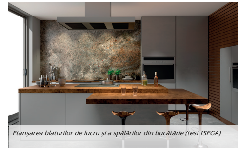
Etanșarea blaturilor de lucru și a spălărilor din bucătărie (test ISEGA)