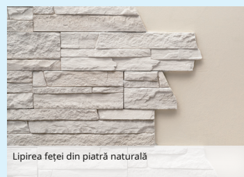
Lipirea feței din piatră naturală