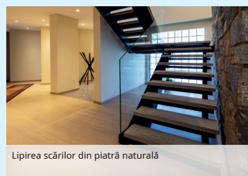
Lipirea scărilor din piatră naturală