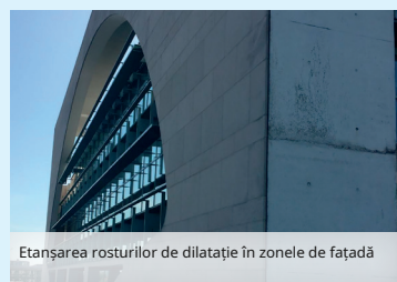
Etanșarea rosturilor de dilatație în zonele de fațadă