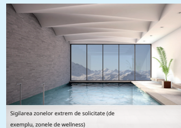
Sigilarea zonelor extrem de solicitate (de exemplu, zonele de wellness)