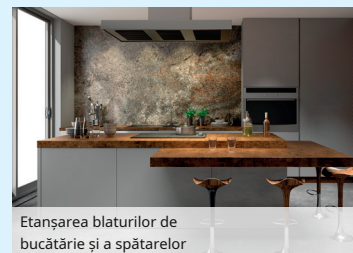
Etanșarea blaturilor de bucătărie și a spătarelor

Retetă îmbunătățită - OTOSEAL S 80 poate fi acum netezit și mai bine