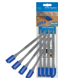
OTTO Fugenfux® set de 4 pentru îmbinări sanitare și pardoseli