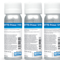
Grund OTTO 1102 Grundul de gresie