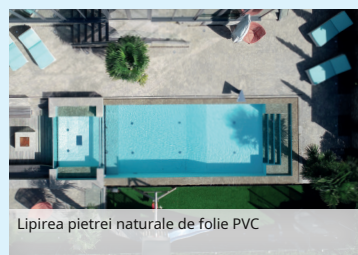
Lipirea pietrei naturale de folie PVC