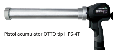
Pistol acumulator OTTO tip HPS-4T