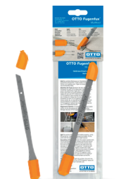
OTTO Fugenfux -linieată multifuncțională