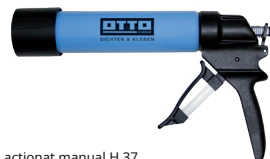
OTTO Pistol actionat manual H 37