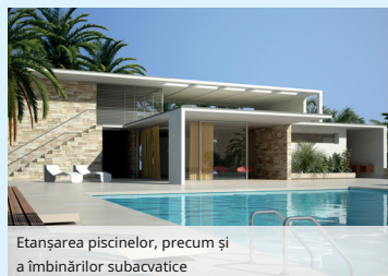
Etanșarea piscinelor, precum și a îmbinărilor subacvatice

A Etanșarea din lăcuit și sticla emailata