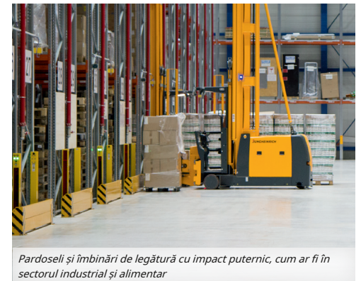
Pardoseli și îmbinări de legătură cu impact puternic, cum ar fi în sectorul industrial și alimentar