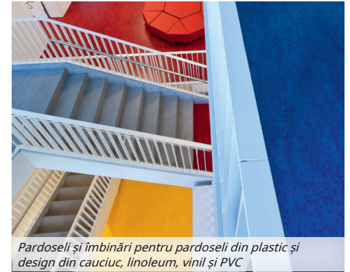
Pardoseli și îmbinări pentru pardoseli din plastic și design din cauciuc, linoleum, vinil și PVC