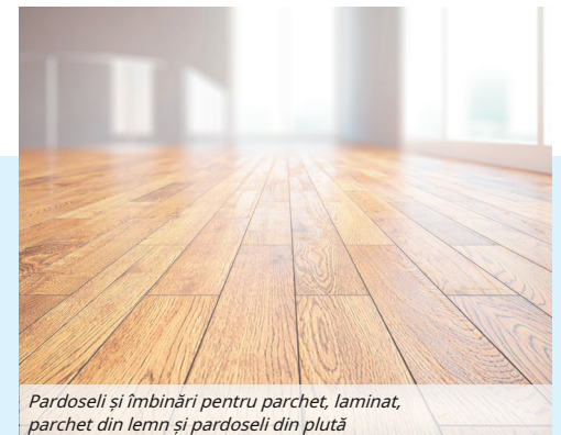
Pardoseli și îmbinări pentru parchet, laminat, parchet din lemn și pardoseli din plută